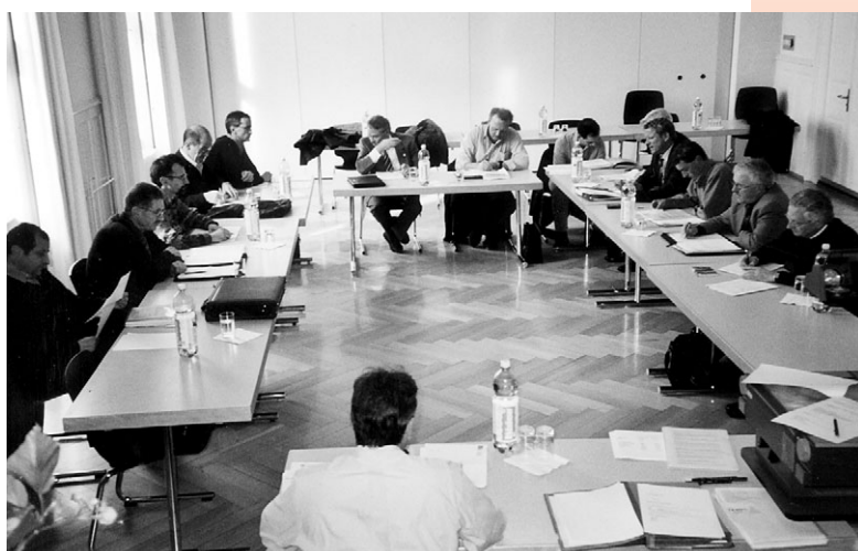
Die Spitaldirektorenkonferenz führte im Jahr 2002 6 Konferenzen durch