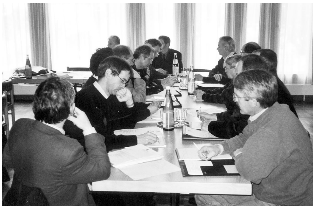
Die Heimleiter/innenkonferenz tagt in der Alterssiedlung Kantengut in Chur