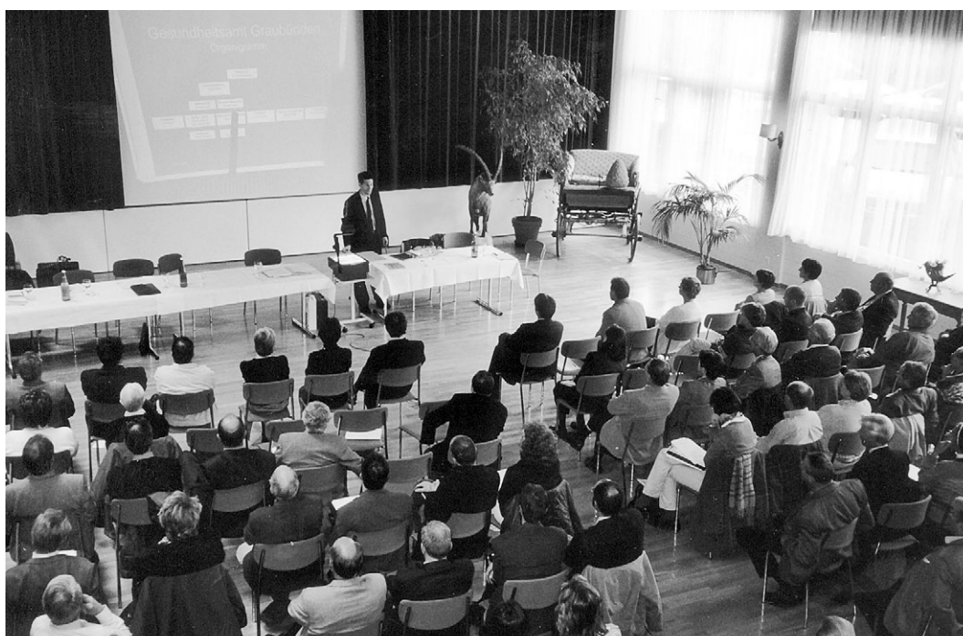
Mitgliederversammlung im Hotel Villa Post in Vulpera