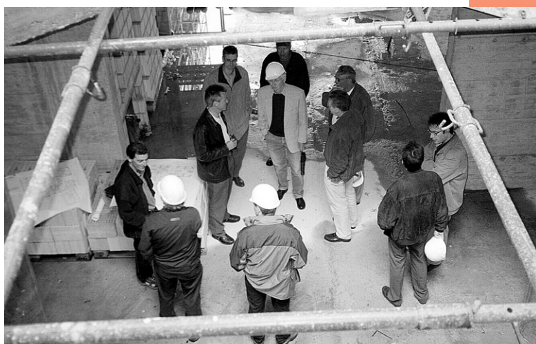
Besichtigung des Neubaus Spital Poschivao anlässlich der Landsitzung der Spitaldirektoren